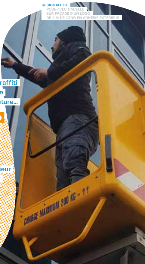
© SIGNALÉTIK POSE AVEC NACELLE SUR FAÇADE D'UN LOGO DE 5 M DE LONG EN ADHESIF EXTERIEUR