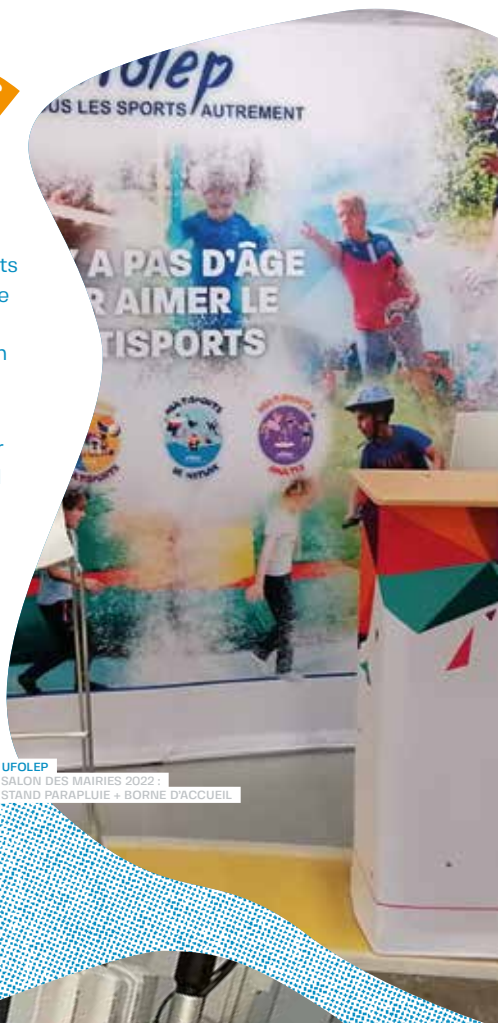
© UFOLEP SALON DES MAIRIES 2022 STAND PARAPLUIE + BORNE D'ACCUEIL